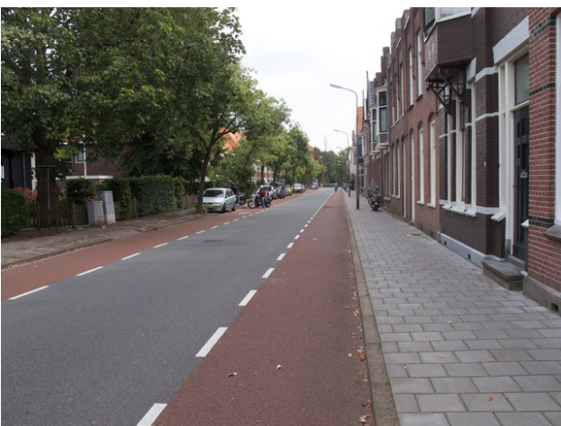
De Julianastraat wordt binnenkort een fietsstraat

Vorig jaar werden de plannen voor deze straat in de ijskast gezet, maar de slechte staat van de riolering maakt het noodzakelijk om de plannen versneld uit te gaan voeren. De straat wordt nu als fietsstraat ingericht en in de toekomst wordt de fietsstraat verlengd tot het busstation. De gemeente streeft naar een lange fietsverbinding tussen het NS station en het Tramplein. Voor de Wilhelminalaan zijn de plannen echter nog niet gereed. De Heerengracht zal na het afronden van de werkzaamheden in de Julianastraat op de tekentafel komen te liggen.