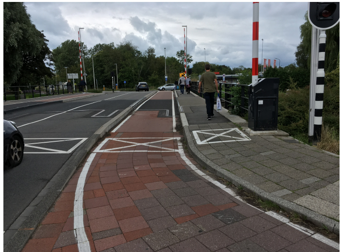
Hoornsebrug na recente aanpassingen

's middags wel gefietst worden. Wij hebben er direct op gewezen dat er een doorsteek door het centrum moest blijven omdat anders er via drukke straten omgereden moest worden. De Koestraat en de Kalversteeg kwamen hiervoor in aanmerking. De gemeente is een proef gestart en heeft d.m.v. krijtverf en bebording aangegeven dat beide straten ook door fietsers gebruikt mogen worden. De oplossing van een gemengd voetgangers en fietsersgebied is niet echt ideaal maar een andere oplossing is er niet. Vooral op drukke dagen levert het nog wat irritaties op. We verwachten dat de ongemakken zullen verminderen als men wat langer aan het fenomeen gewend is geraakt.