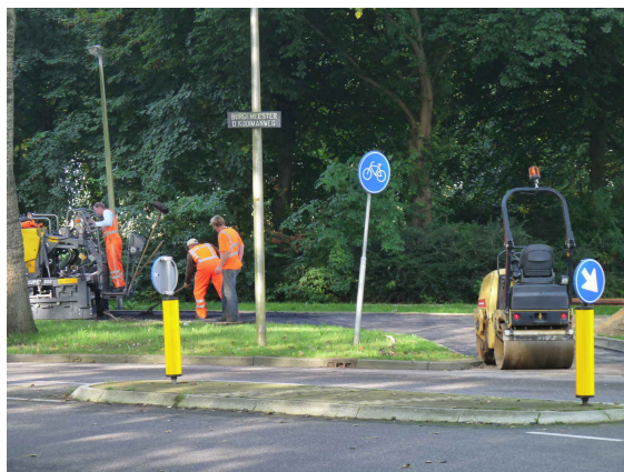
Asfalteringswerkzaamheden aan een deel van de burgemeester Kooimanweg.

De gemeente vervangt op hoofdroutes, waar onderhoud noodzakelijk is, nu al zoveel mogelijk tegels door rood asfalt.