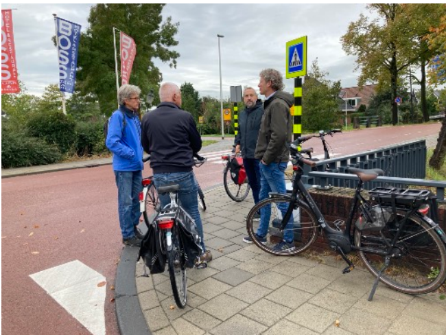
Druk overleg in de Zuidoostbeemster

Verder gefietst naar het kruispunt Purmerenderweg- Middenpad. Over deze kruising moeten 's ochtends en 's middags veel schoolgaande kinderen. De gemeente heeft hier al het een en ander gedaan om deze oversteek veiliger te maken. Toch blijft de gemeente zoeken naar een afdoende oplossing. Er wordt nu aan een middeneiland gedacht zodat fietsers en voetgangers in twee delen kunnen oversteken. Probleem is ech-