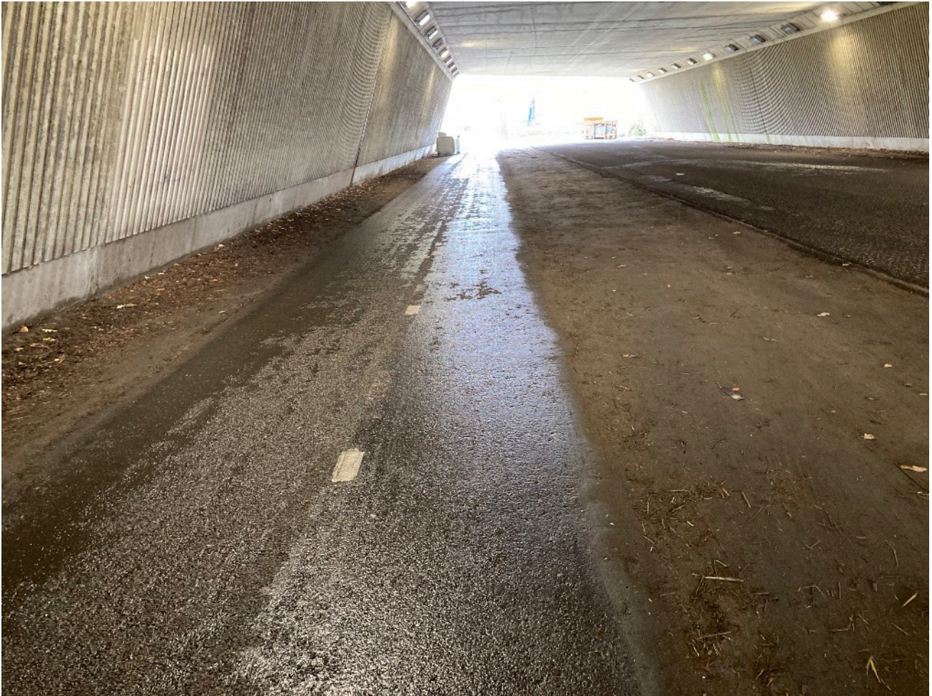
Fietspad Zuiderweg onder viaduct A7