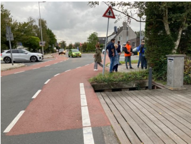
Kruising IJdoornlaan- Zuideinde in Landsmeer

Begin oktober hebben we op uitnodiging van de wethouder van Landsmeer een fietstocht gemaakt door de gemeente. Om acht uur 's ochtends verzamelden de genodigden zich bij de kruising IJdoornlaan- Zuideinde. Een onophoudelijke stroom auto's passeerde op weg naar de A10. Het blijkt dat ook veel inwoners van Purmerend deze (sluip) route gebruiken. Er wordt gefluisterd dat vele Purmerenders lid zijn van de visvereniging en hierdoor toestemming hebben om het inrijverbod tijdens de spitsuren te omzeilen. Wij hebben de wethouder gevraagd wat hiervan klopt. De doorgaande weg (het lint) is een lappendeken van asfalt/straatstenen met zo nu en dan fietsstroken al dan niet in rood uitgevoerd. De weg is smal en in het centrum van Landsmeer hebben fietsers veel last van laden en lossen. Onderweg is veel gesproken met omwonenden en die klaagden veel over hardrijders. De wethouder beloofde alle opmerkingen mee te nemen en met voorstellen ter verbetering te komen.